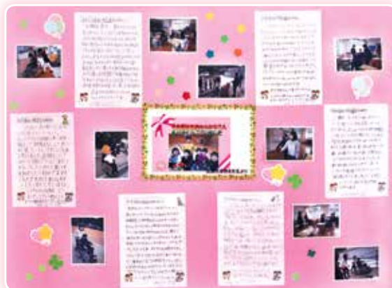
お礼のお手紙をいただきました。