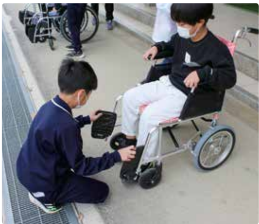
令和3年12月、広野小学校4年生を対象に 車イス・アイマスク体験学習を行いました。